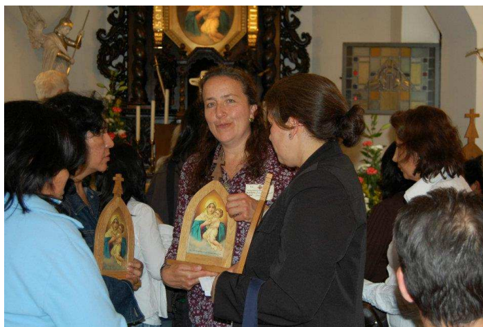
LA AUTORA DEL ARTÍCULO CON LA VIRGEN PEREGRINA