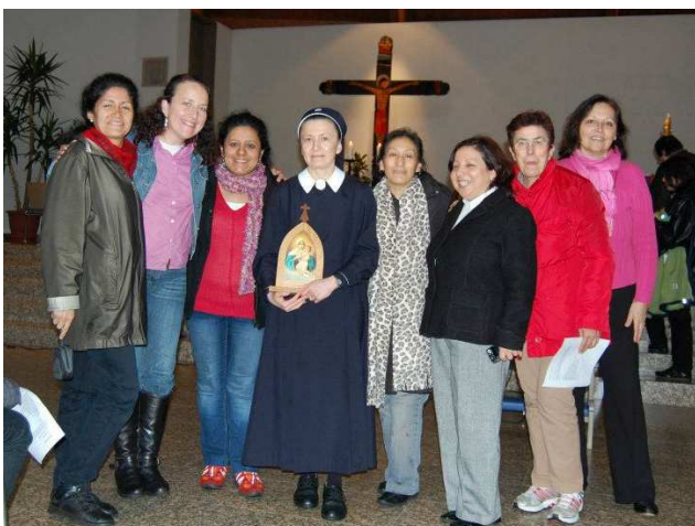
EN LA CAPILLA DE SCHÖNSTATT EN VALLENDAR