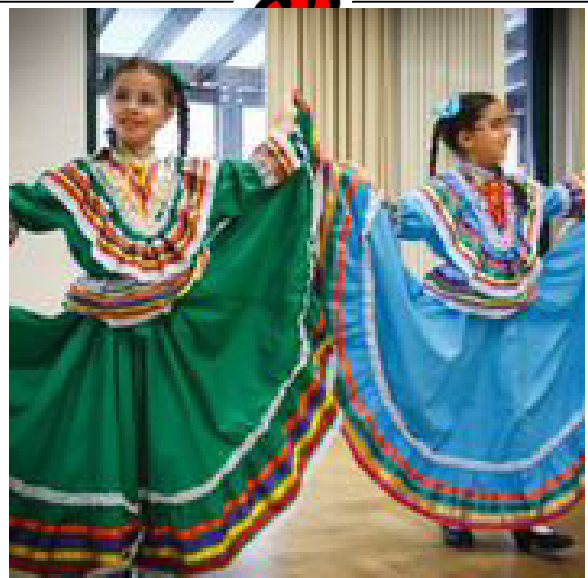
FIESTA PARROQUIAL - BONN